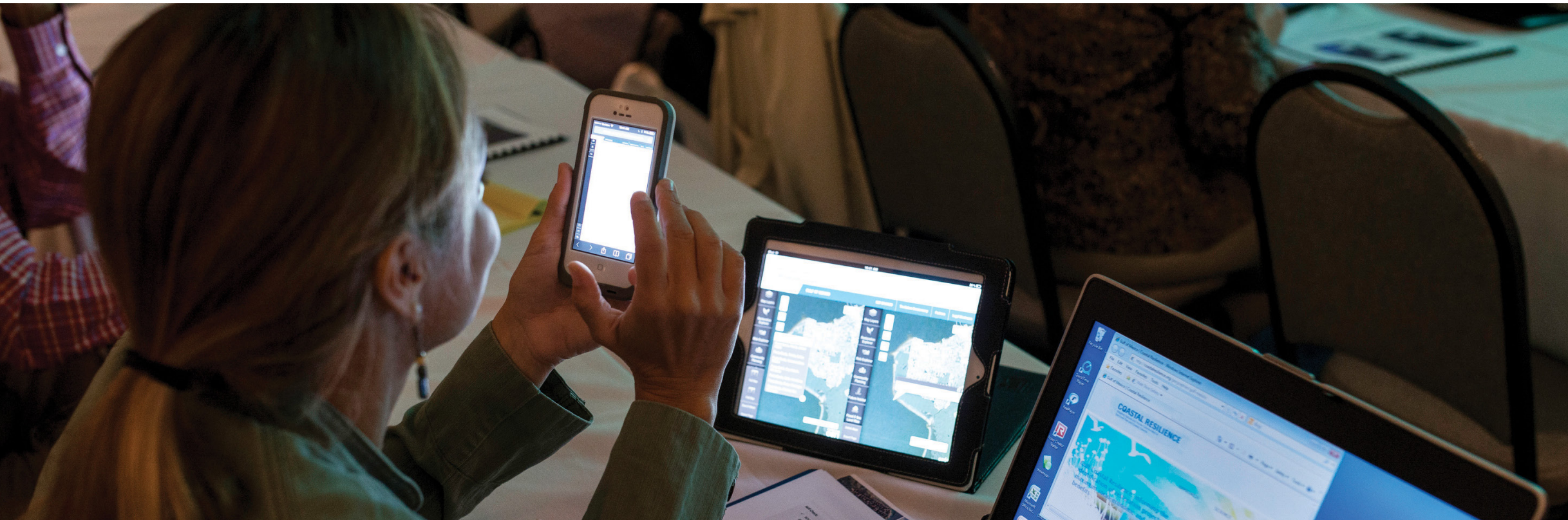
© CARLTON WARD JR. Oktober 2013. Workshop Ketahanan Pesisir The Nature Conservancy di Punta Gorda, Florida.