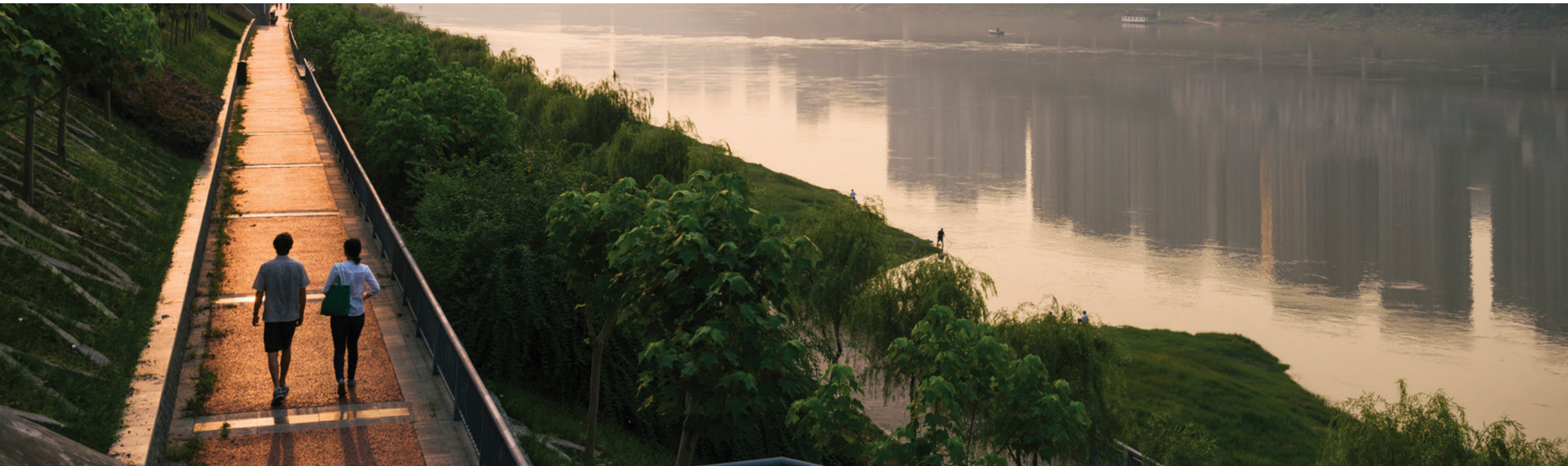
© KEVIN ARNOLD Juli 2015. Sungai Yangtze yang mengalir di sepanjang Tiongkok dan berakhir di Laut Tiongkok Timur di dekat kota bersejarah Shanghai. Conservancy bekerja sama dengan mitra Tiongkok untuk berinvestasi pada konservasi daerah aliran sungai serta terlibat dalam industri tenaga air melalui perencanaan, perancangan, dan pengoperasian dam yang lebih baik lagi.