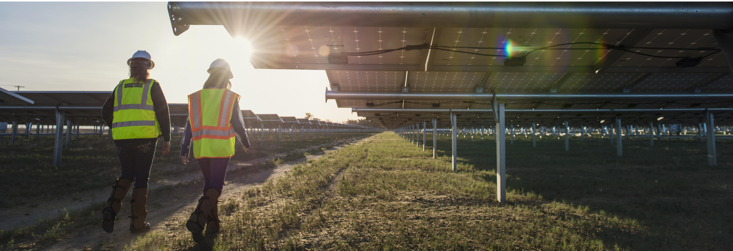
Panel surya di pabrik Fuller Star di Lancaster, California.