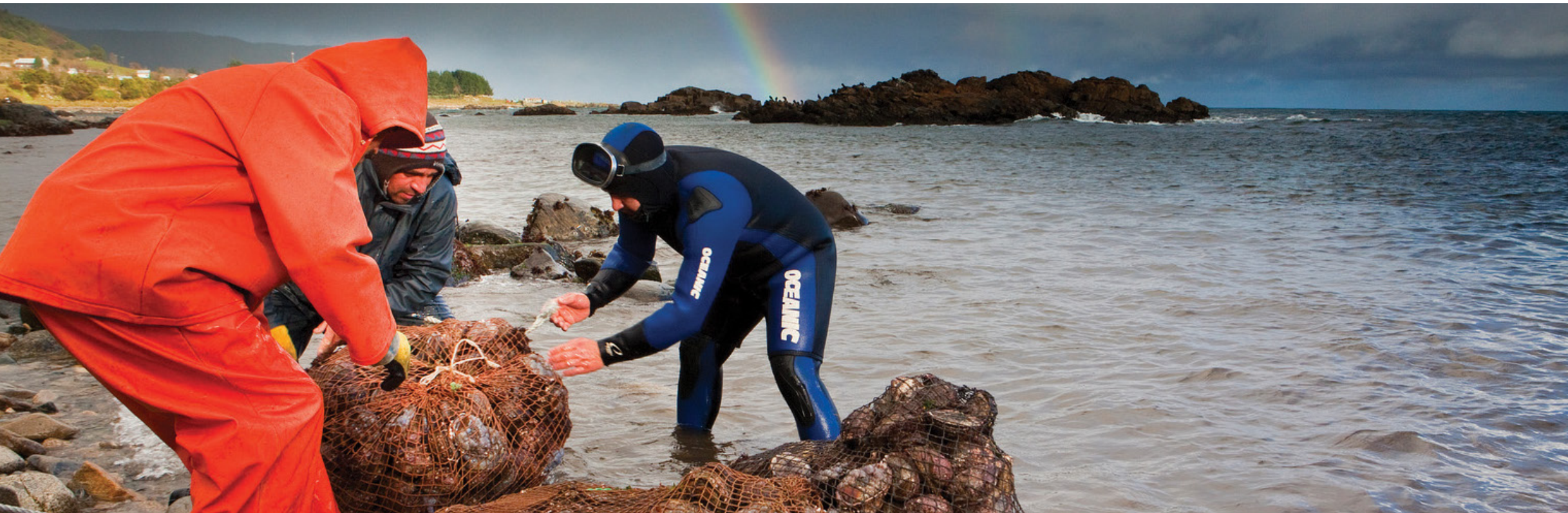
Perikanan Loco di asosiasi Nelayan Huape, Palo Muerto Locality, Chili. Loco adalah sejenis Abalon Chili dan penting untuk ekonomi lokal karena nilainya yang tinggi. Panen abalon ini dilakukan setahun sekali.

MANUSIA DAN ALAM BERKEMBANG PESAT KETIKA KITA . . .